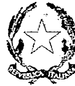
Ministero dell'Istruzione dell'Università e della Ricerca